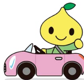
こくみん共済 coop 公式キャラクター ビットくん