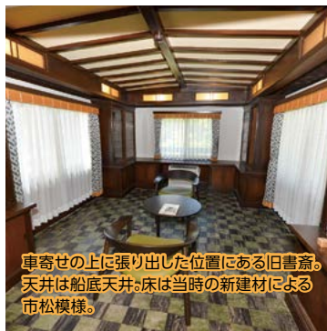
車寄せの上に張り出した位置にある旧書斎。天井は船底天井。床は当時の新建材による市松模様。