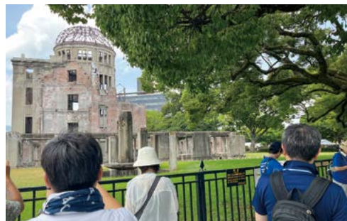
原爆ドーム前にて