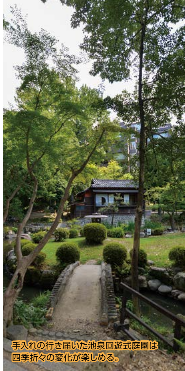
手入れの行き届いた池泉回遊式庭園は四季折々の変化が楽しめる。