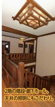
2階の階段・廊下ホール。天井の照明にもこだわり。