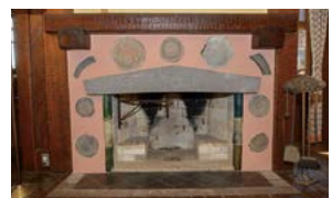
旧食堂の暖炉の周りには各地の有名寺院の古代瓦がはめ込まれている。