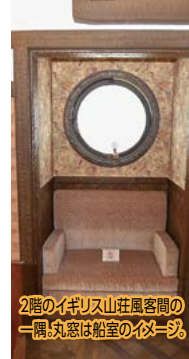
2階のイギリス山荘風客間の一隅。丸窓は船室のイメージ。