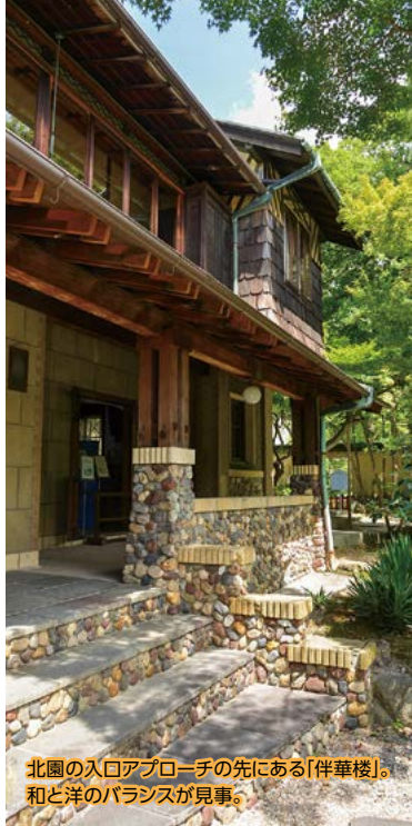
北園の入口アプローチの先にある「伴華楼」。和と洋のバランスが見事。