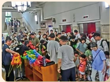
お子様への記念品