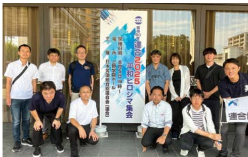
平和ヒロシマ集会

今回の参加を通じて、あらためて「戦争の悲惨さ」と「平和の尊さ」を痛感する2日間となりました。