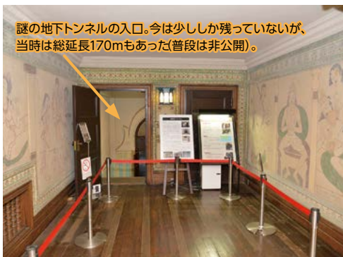
謎の地下トンネルの入口。今は少ししか残っていないが、当時は総延長170mもあった(普段は非公開)。