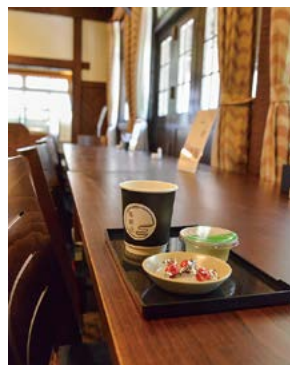
旧食堂でいただいたジュースとゼリーとお菓子。落ち着いた雰囲気。