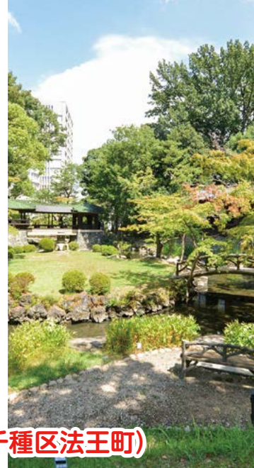
揚輝荘（名古屋市千種区法王町）

名古屋市・覚王山といえば、閑静な住宅街として知られる。地下鉄覚王山駅から日泰寺に至る参道は毎月21日の縁日で賑わうが、その参道の途中に「揚輝荘（南園）」、日泰寺正門すぐ手前には「揚輝荘（北園）」の小さな緑色の立て札がある。北園は現在、庭園と建物外観だけが見られるが、南園の迎賓館「聴松閣」は平成25年（2013年）に修復整備され、インド風の旧舞踏場や壁画のある地下室から1階の喫茶室、和・洋・中の様式を採り入れた各居室と展示物を公開。コンサートや各種文化イベントなどに貸室利用も可能となっている。