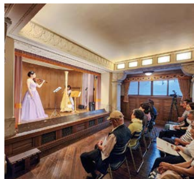
室内から落語、能狂言まで多彩な企画プログラムが繰り広げられる地階の旧舞踏場。

かつて、その最盛期には1万坪の敷地に30余りあった揚輝荘の建物も、今では、大空襲の被害や老朽化・マンションや商業施設などの開発などにより、2800坪の敷地に5棟の名古屋市指定有形文化財と2つの庭園を残すのみですが、平成25年(2013年)に修復整備工事を終えたハーフティンバー(建物の木製フレームを意図的に露出させる建築様式)の外壁が特徴の★聴松閣(ちょうしょうかく)と北庭園は公開中。南庭園は毎週水曜と土曜に公開。それ以外の建物では… ★伴華楼(ばんがろう)/尾張徳川家ゆかりの座敷と洋室。★白雲橋(はくうんきょう)/北庭園のシンボル。京都修学院離宮の千歳橋を模したとも。祐民作と伝わる龍の天井画が見られる。★三賞亭(さんしょうてい)/伊藤家本宅から移築された揚輝荘最初の建物。煎茶の茶室。以上の3つはイベントなどで時々公開。★揚輝荘座敷(ようきそうざしき)[現在非公開]/大正8年に今の松坂屋本店の敷地にあった屋敷を移設。どれも個性的な建物なので修復整備後の公開が待たれるものばかりだ。