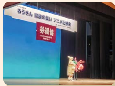
ミルキーちゃんの歌とバルーンショー