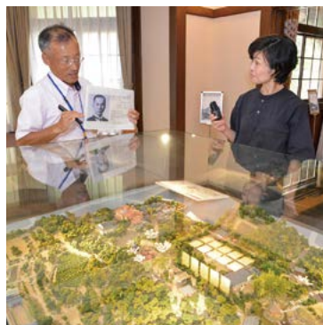
旧サンルームにある揚輝荘の最盛期のジオラマ。想像しながらの解説は楽しい。