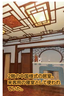
2階の中国様式の居室。来客用の寝室として使われていた。

藤屋が明和5年(1768年)に江戸に進出したときに買収した上野の呉服店のもの。江戸の地では知名度のある「松坂屋」の名を残し「いとう松坂屋」としていた。