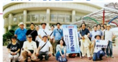
沖縄の平和行動に参加したみなさん

した。2日目の現地学習会で訪れた糸数アブチラガマでは、ひめゆり隊が軍人を介護した場所や、住民が避難生活をした場所を見学し、アブチラガマ内で尊い命を奪われた御霊に対し、全員で黙祷を捧げました。その後、沖縄県庁前で開かれた集会に続き、在日米軍基地の整理・縮小や日米地位協定の抜本的見直しを求めるデモ行進を行い終了しました。