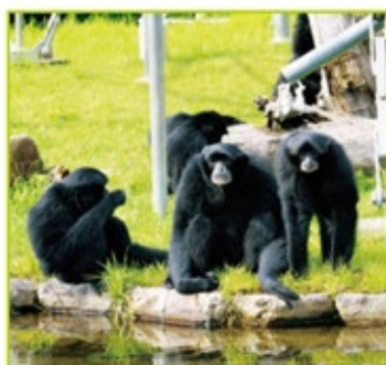
いつも仲のいいフクロテナガザルの一家。顎の下の袋を使って合唱する。

●交通機関 / 名鉄犬山線「犬山」駅東口より路線バス「日本モンキーパーク行き」約5分