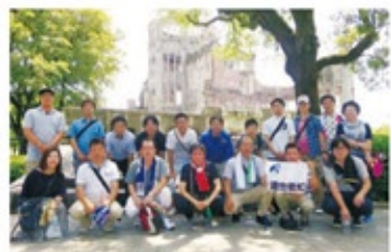
広島の平和行動に参加したみなさん

2日目は、広島市原爆死没者慰霊式並びに平和祈念式に参加し、核兵器廃絶、恒久平和の実現のための取り組みを、さらに広げていくことを参加者全員で確認しました。