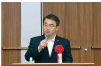
大村愛知県知事による記念講演