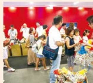
子供さんへ記念品