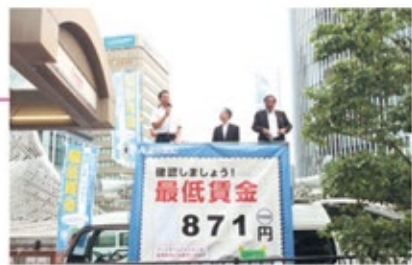
愛知県の最低賃金を訴える街頭宣伝の様子

とその使用者に適用されます。連合愛知は今後も、未組織労働者や非正規労働者の労働条件向上のため、賃金のセーフティネットを強化し「すべての労働者の労働条件の改善」に取り組んでいきます。