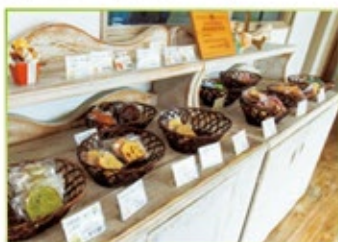
店頭に並んだパウンドケーキとクッキー各種。贅沢な素材がふんだんに使われている。