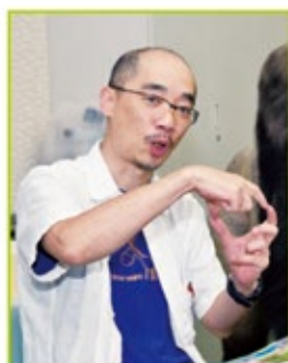
学術部長の友永雅己教授は京大の霊長類研究所の教授でもある。