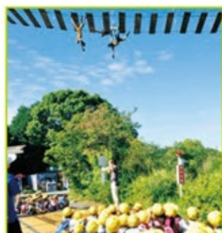
実際にサルを観察しながら飼育員が解説するスポットガイド。