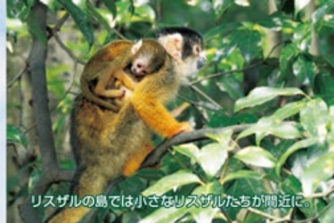
リスザルの島では小さなリスザルたちが周辺に。