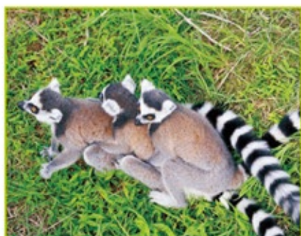
朝からの雨も上がったのが嬉しいのか所狭しとはしゃいで飛び回る「Waoランド」のワオキツネザル。