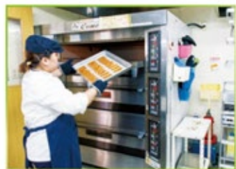
おいしいクッキーが焼きあがった。大量注文にも応える大型のオーブンは思い切って設備投資。