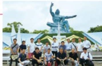
長崎の平和行動に参加したみなさん

平和祈念式典終了後、連合長崎青年・女性委員会のピースガイドによる連合2017 PEACE WALKに参加しました。