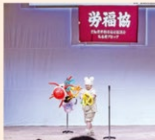
ミルクィちゃんの歌とパルーンショー