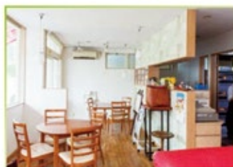
広い厨房の前に設けられた喫茶スペース。出来たての美味しさは製造直売ならでは。