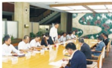
愛知県への要請行動 意見交換の様子