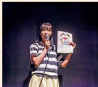
「働く人にありがとう」メッセージ募集案内