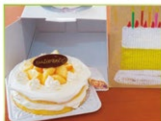
子どもがお父さんと描いた絵に基づいて作られた1点もののパースデーケーキ。