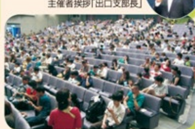
主催者挨拶「出口支部長」

ファミリー映画会「ペット」 2017年7月15日 参加:204家族754名 場所:知多市勤労文化会館「つつじホール」