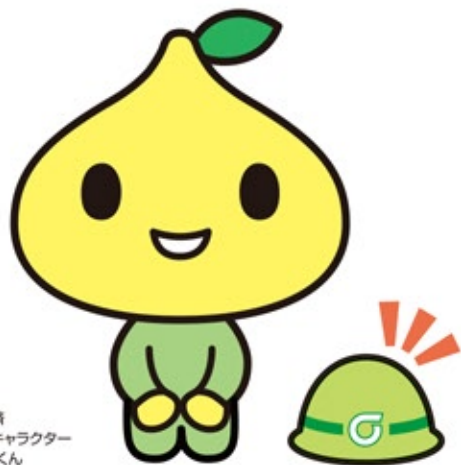
全労済 公式キャラクター ピットくん