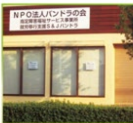
「パンドラの会」の活動は「就労支援」から「就労移行」へと新しい段階を迎えた。