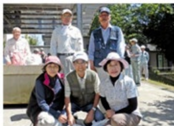
団体優勝の知多支部東海地区友の会チーム