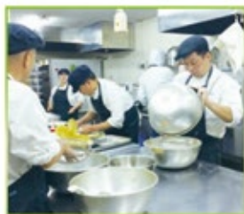
お菓子の仕込み・下ごしらえはみんなが協力。チームワークが大事。