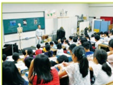
霊長類に関する資料や標本などのあるビジターセンターの中にあるホールでレクチャーを受ける生徒たち。