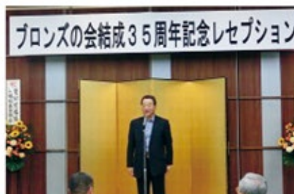
結成35周年記念レセプション