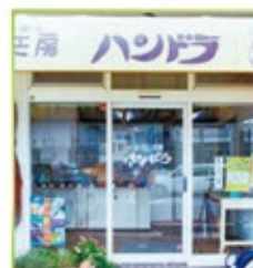
お店は幹線道路からちょっと入ったところにある。