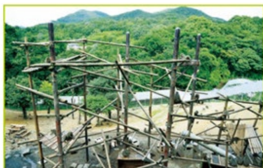
樹上生活に快適なようにとヤクニホンザルの福祉にも配慮された「モンキーパレイ」の構築物。彼らは冬に焚火にあたる。